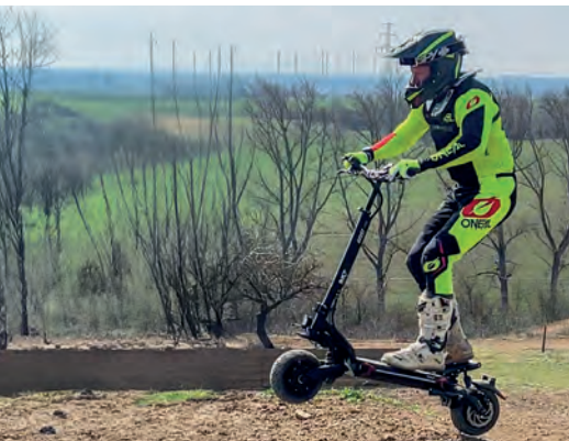
E-Scooter-Racing ist eines der neuen Projekte des ADAC Hessen-Thüringen – ebenso wie E-Kart-Slalom und Ortsclub-Mitgliederreisen, die zusammen mit dem HFM durchgeführt werden.